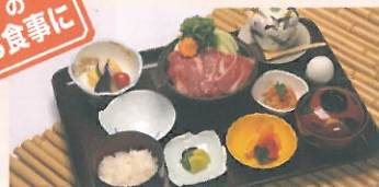
飛騨牛鍋御膳 2,380円(60名様まで)