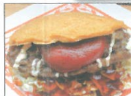
お米のオムレツバーガー 食道楽のカレー 食道楽のカフェ