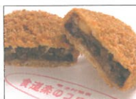
食道楽のコロッケー 「食道楽のコロッケーと小倉ドッグ」の店 「食道楽のコロッケー」の店

愛知県出身の村井弦齋により、明治時代に書かれた恋愛グルメ小説『食道楽』に記載されたレシピを、明治村で再現し、現代風にアレンジしました。