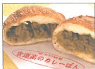
食道楽のカレーぱん 「食道楽のカレーぱん」の店