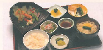
明治定食 1,520円(60名様まで)