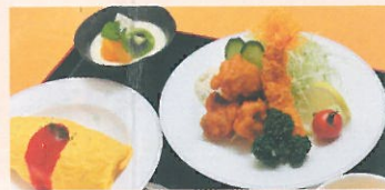
ハイカラ御膳 1,500円(120名様まで)